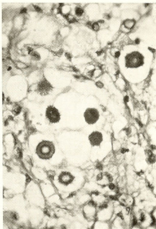
Fig. 2 — Cryptococcus neoformans no tecido nervoso. 2.000 X